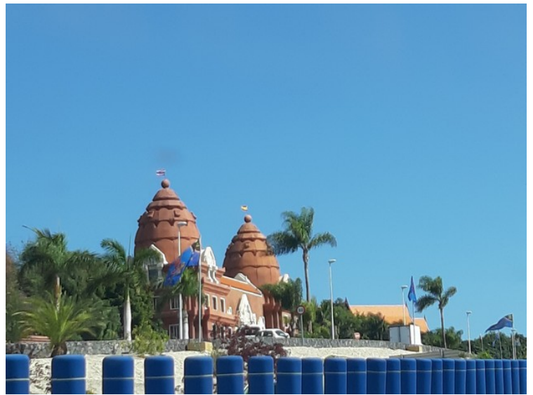
Her kjører vi forbi Siam Park i Costa Adeje .