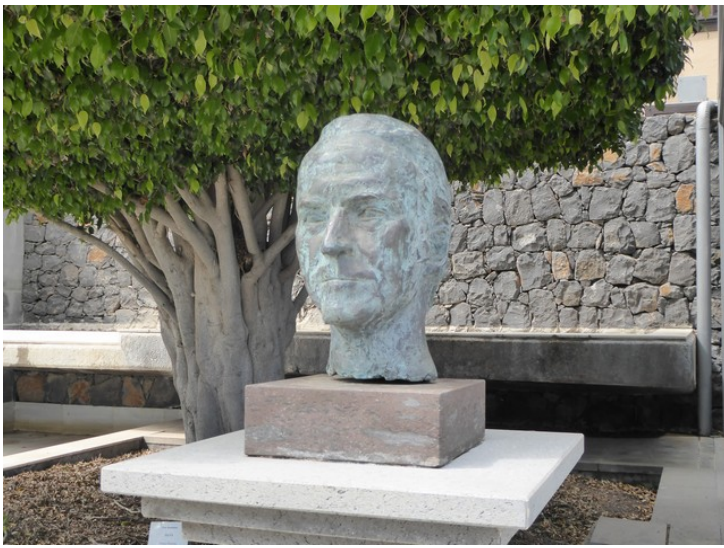
En byste av Thor Heyerdahl.