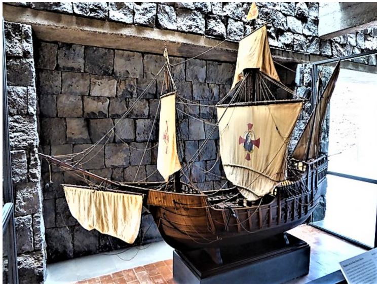
En miniatyrkopi av seilskipet, Santa Maria , som Chrisofer Columbus reiste til Amerika med i 1492.