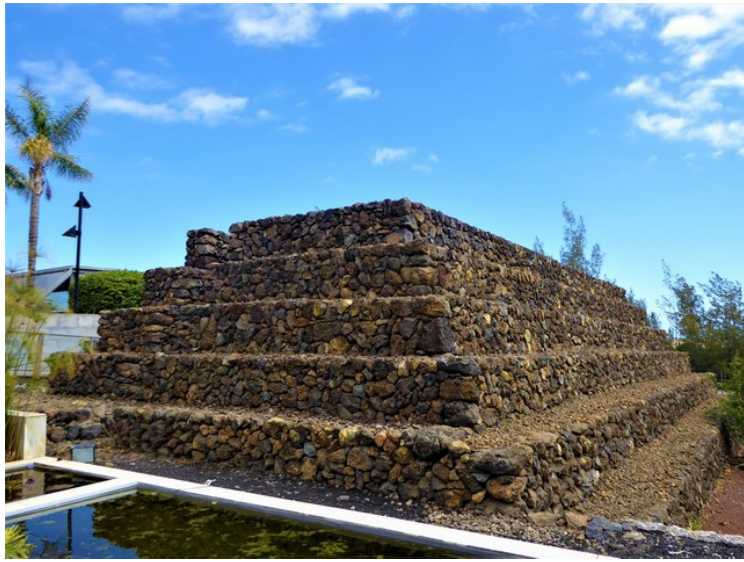
Dette er pyramiden som står rett innenfor inngangen.