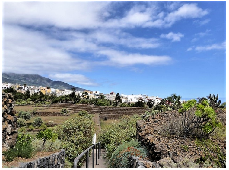
Det er flere pyramider lenger borte.