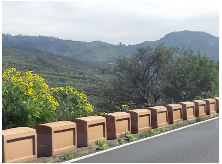
Dette er moderne stabbesteiner .