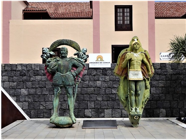
En statue av en spansk erobrere og en Guanche . Guanche er den eldste kjente befolkningsgruppen på Kanariøyene, som nå enten er utdødd eller assimilert med de europeiske innvandrerne.