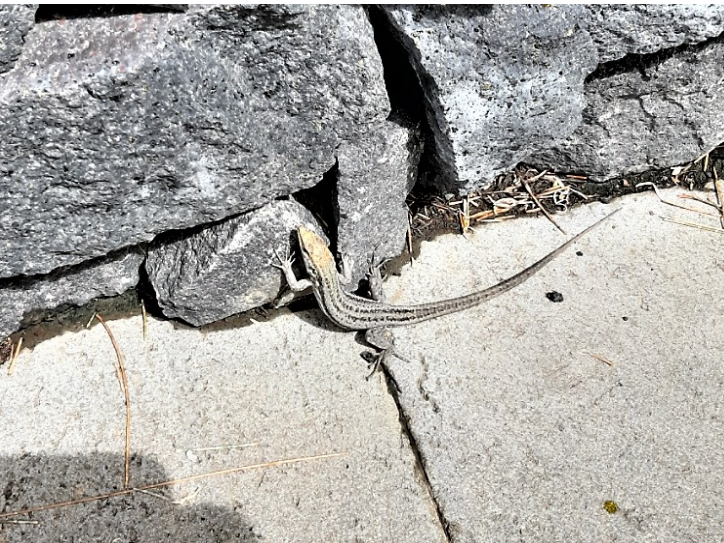
Dette er en ekte firfisle som bodde her.