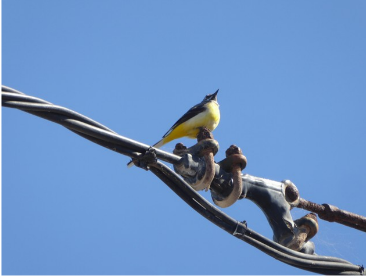
Vi fikk besøk av en gulerle en av dagene.