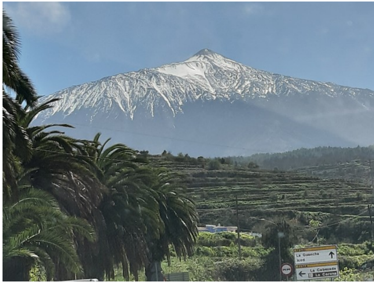
Teide er godt synlig det meste av veien.