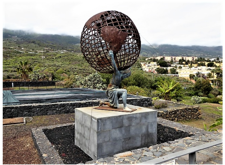
En statue av Atlas som bærer jordkloden på sine skuldre.