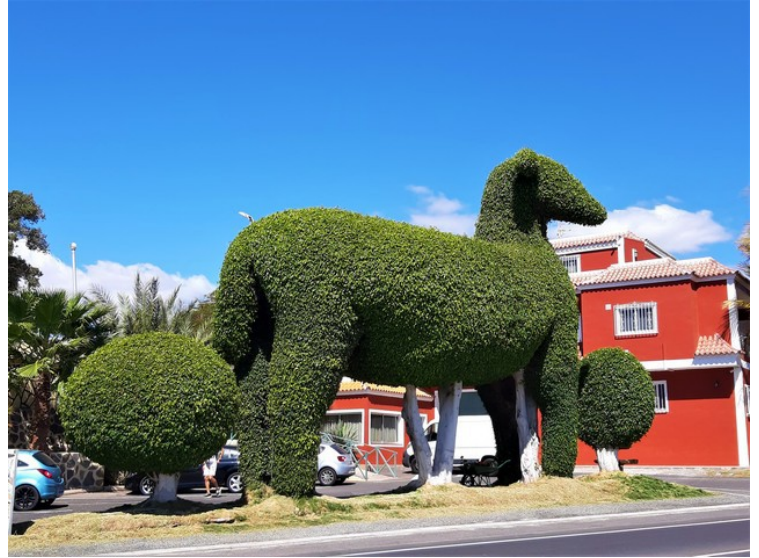
Utenfor restaurant Cordero i Guargacho har de klippet trærne slik at de ser ut som en stor hest.