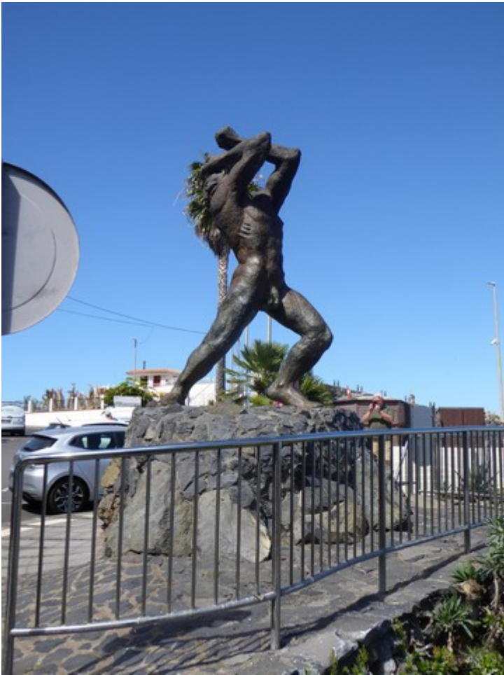
På utsiktspunktet står denne bronsestatuen. Det er Mencey Bentor, en guancho-konge som valgte å hoppe utfor stupet her i stedet for å bli tatt til fange av de spanske troppene som erobret øya.