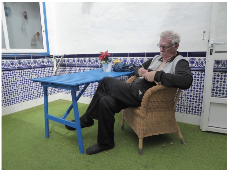
Jeg løser Sudoku på uteplassen.