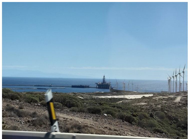
Her er vi på motorveien nordover og er kommet til kommunen Granadilla , rett nord for flyplassen. Her ligger den største industrihavnen på Kanariøyene, Puerto Industrial de Granadilla. Havnen ble offisielt åpnet den 2. mars 2018.