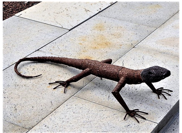
Statue av en kanarisk firfisle . Det er 7 arter og de lever bare på Kanariøyene.