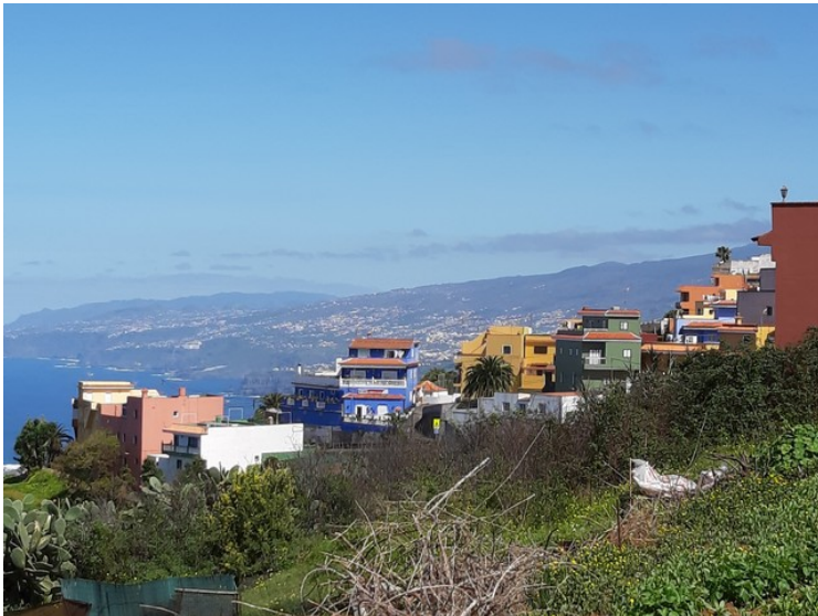
Så kjørte vi videre. Vi kan fremdeles skimte Orotavadalen.