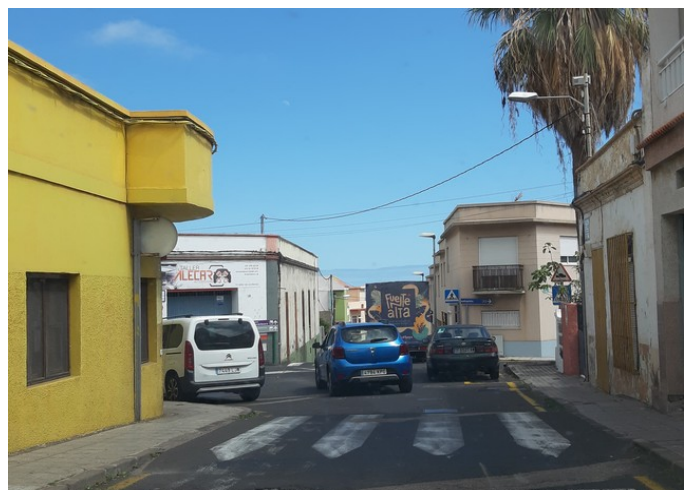
På vei gjennom Güimar ned til motorveien.