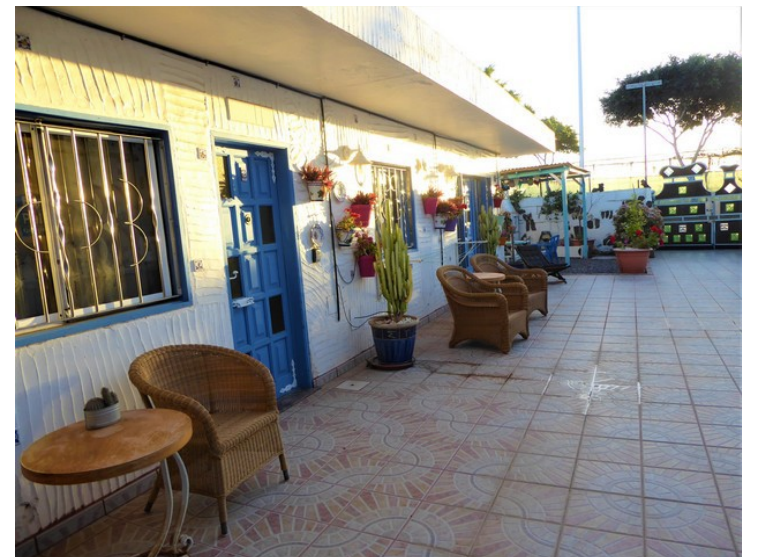
Så var vi på vei ut for å reise tilbake til Norge.

Vi måtte være ute av leiligheten før klokka 11.00.