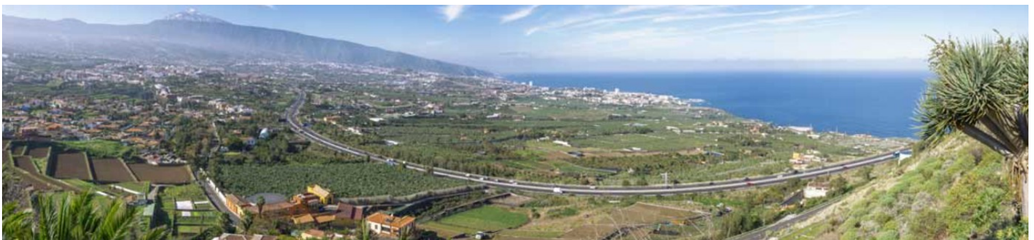
Orotavadalen sett fra nordøst.