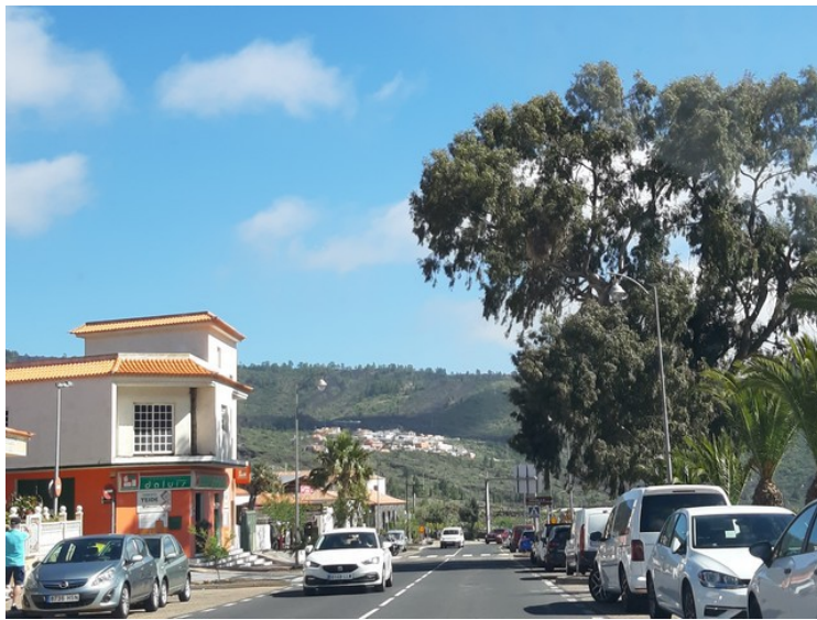
Her er vi kommet til Santiago del Teide .