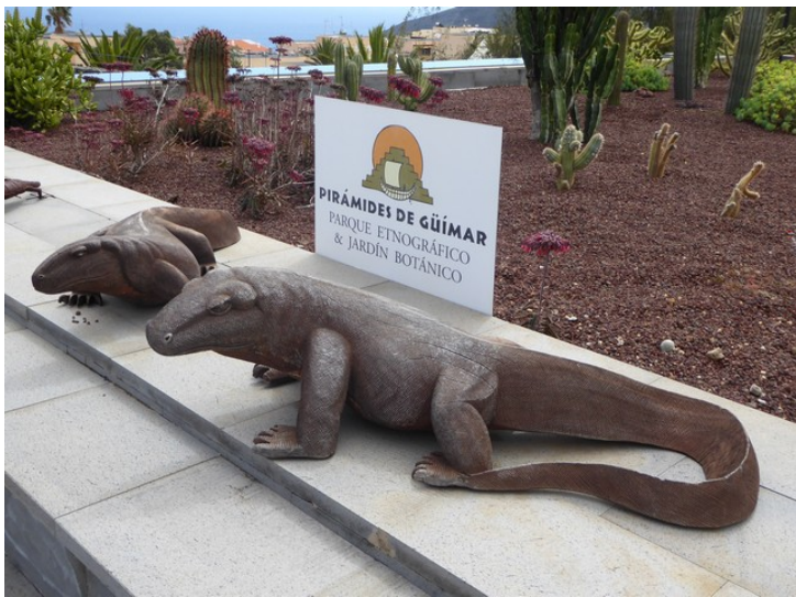
Statuer av komodovaraner .