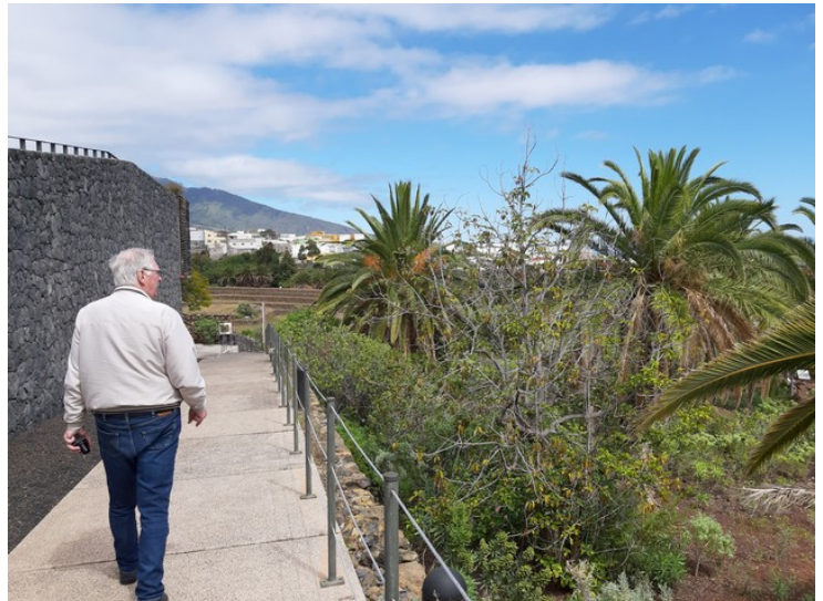
Dokumentasjon på at jeg var der.