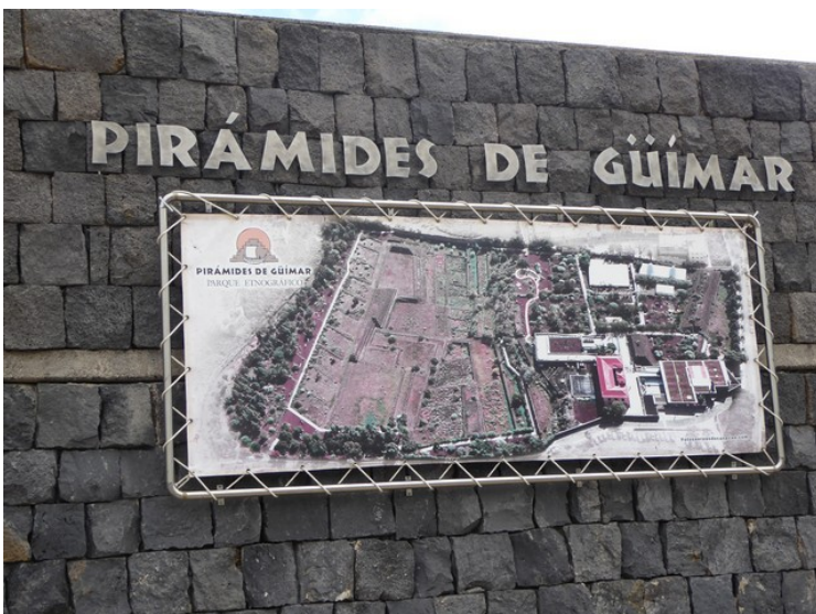
Første stopp var ved Pyramidene i Güimar .