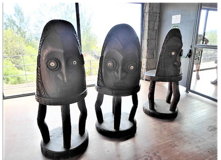
Stoler, forside og bakside.