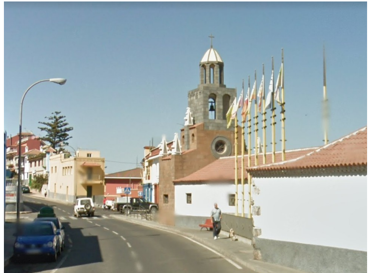
Dette er i Icod el Alto .