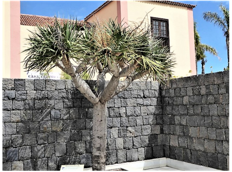
Et lite drageblodstre . Hvis stammen skades, pipler det fram en blodrød harpiks, «drageblod», som innen naturmedisinen og alkymien ble priset for sine antatte medisinske virkninger og magiske krefter. Det eldste drageblodstreet skal være 1000 år gammelt og står i byen Icod de los Vinos .